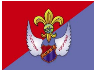
Հ. Մ. Ը. Մ.ի Սկառուտական Դրօշակը (Տես՝ յօդուած 9, էջ 14)